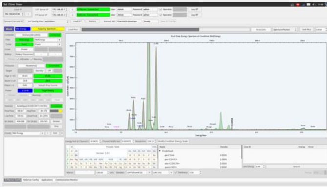
Fast FP 软件