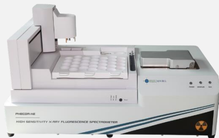
台式机 HS XRF: PHECDA-HES