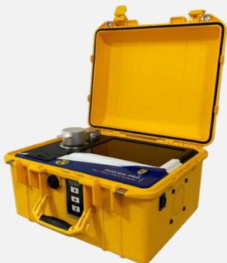
便携式 HS XRF: PHECDA-PRO